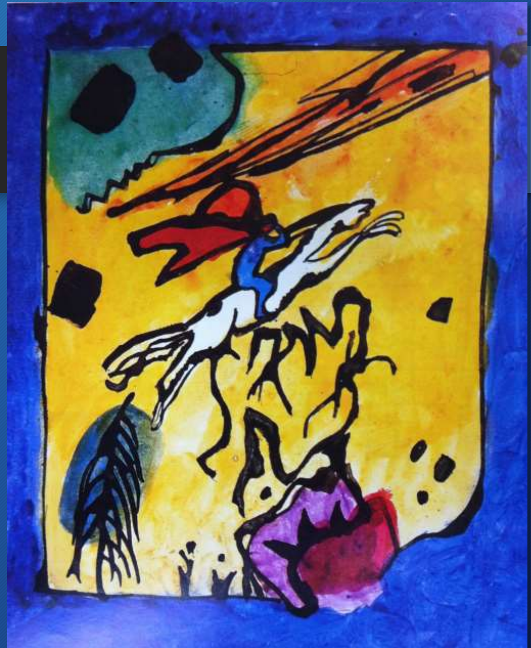
Vasilij Kandinskij, copertina del Blaue Reiter, 1911, Collezione privata

Gli artisti del Blaue Reiter sono convinti che ogni artista debba compiere una specie di «viaggio purificatore» fino a riscoprire l'espressività dei primi scarabocchi infantili, in cui l'immagine riflette le emozioni.