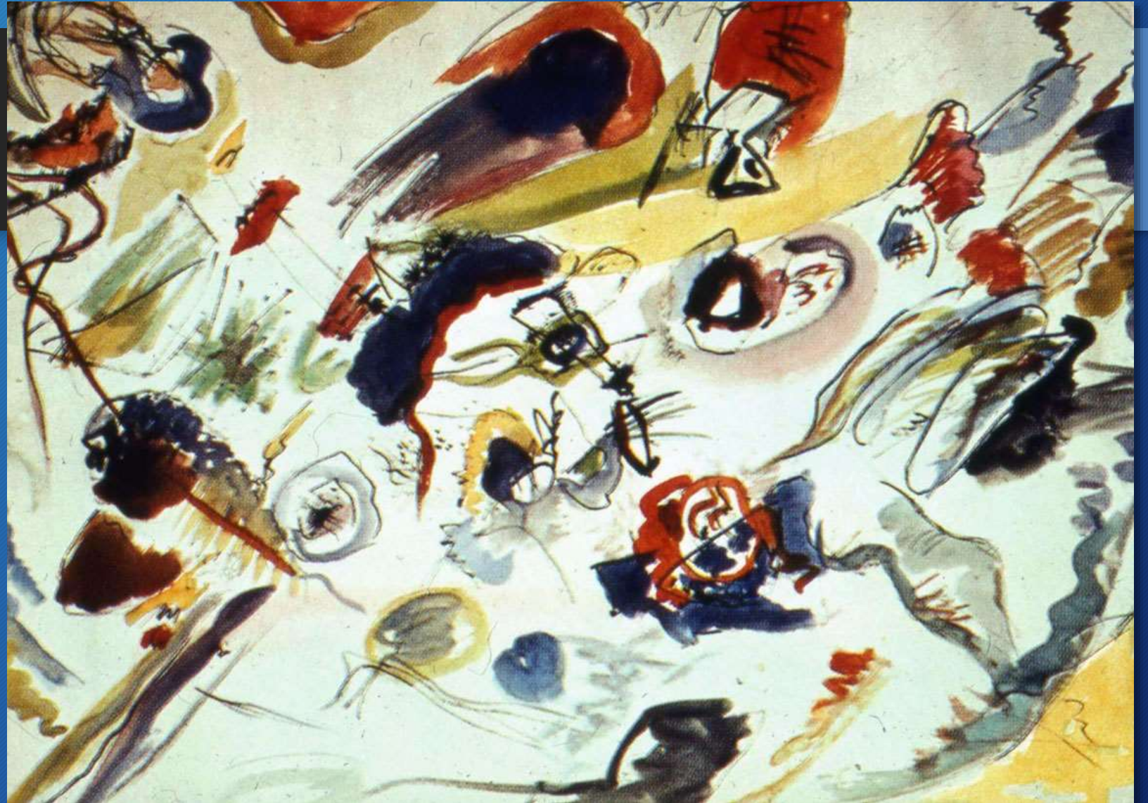
Vasilij Kandinskij, Senza titolo, Parigi, Museo Nazionale di Arte Moderna, Centro Georges Pompidou