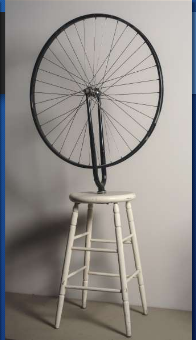
Marcel Duchamp, Scolabottiglie e Ruota della bicicletta