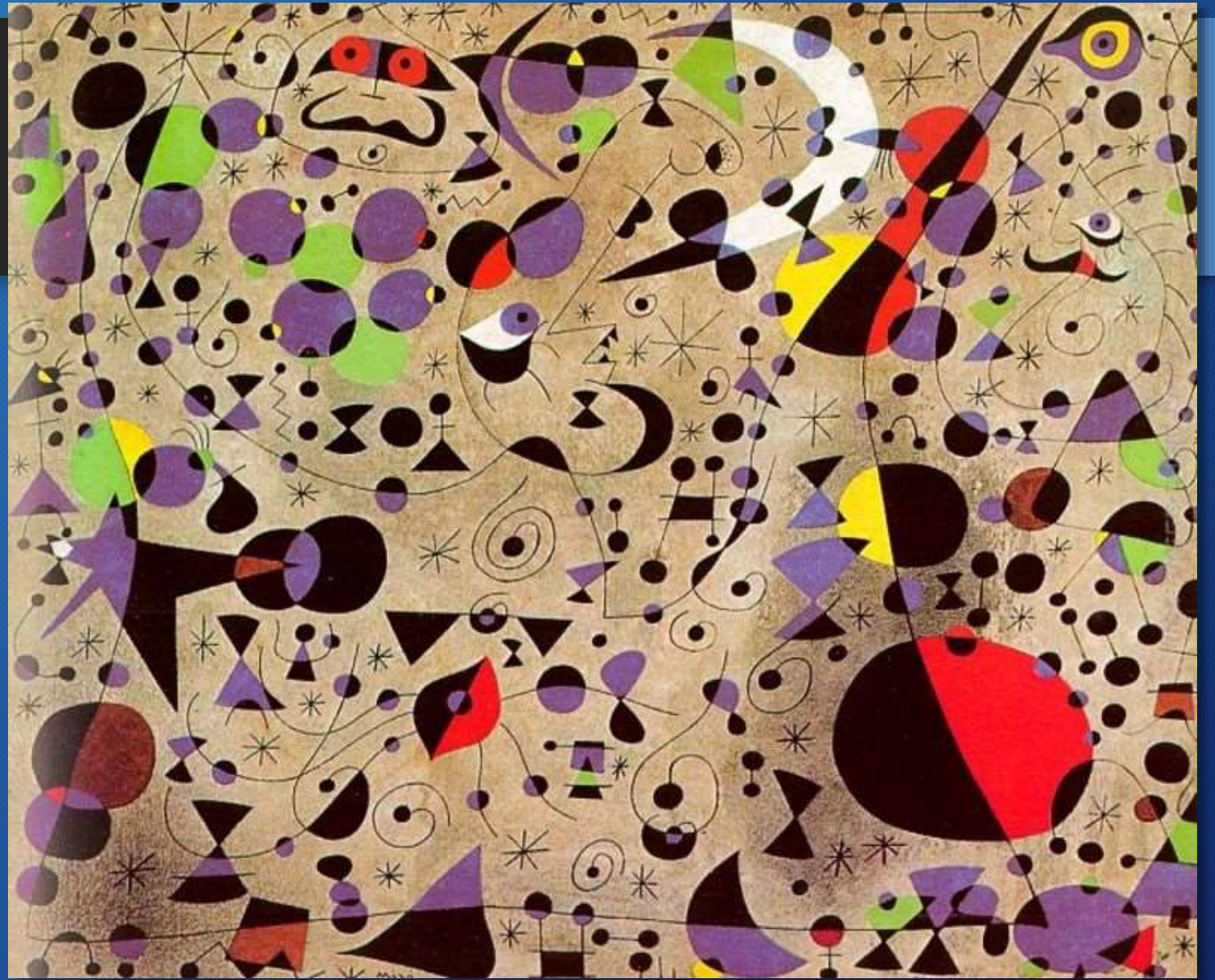
Joan Mirò, La poetessa, 1940 Collezione privata

Le forme ritagliate, ispirate spesso ad animali, uccelli, pesci, insetti e costellazioni, si compongono liberamente su sfondi di colore variegato.