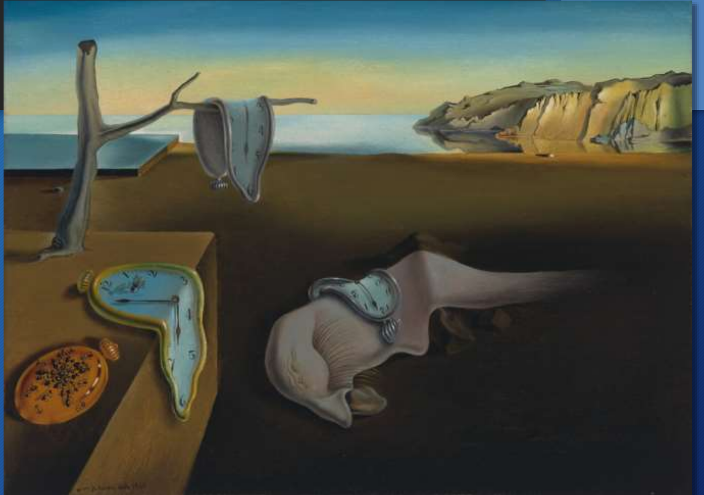
Salvador Dalì, La persistenza della memoria, 1931 New York, Museum of Modern Art

Dalì crea immagini che riproducono con precisione fotografica alcune caratteristiche della realtà, ma che nel loro complesso sembrano frutto di allucinazioni, nate da una mente delirante.