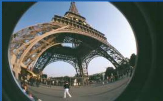
Esempio di inquadratura Fish Eye

L'inquadratura è ad « occhio di pesce », che dilata la visuale a 360 gradi.