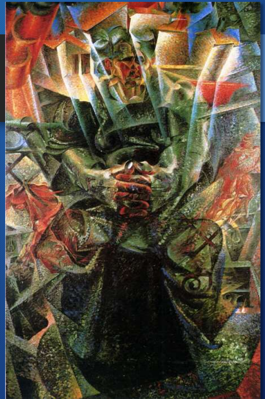
Umberto Boccioni, Materia, 1912 Venezia, Peggy Guggenheim