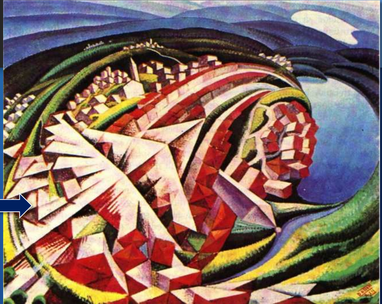
Gerardo Dottori, A 300Km sulla città, 1934 Collezione privata