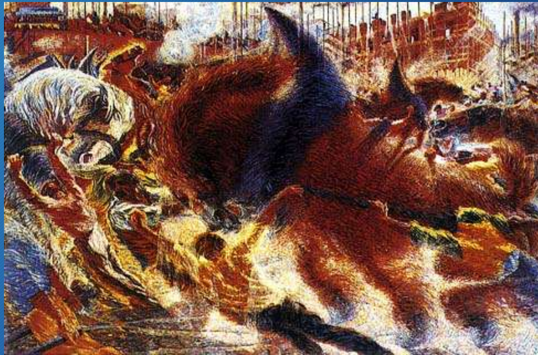
Umberto Boccioni, La città che sale, 1910 New York, Museum of Modern Art (MoMa)