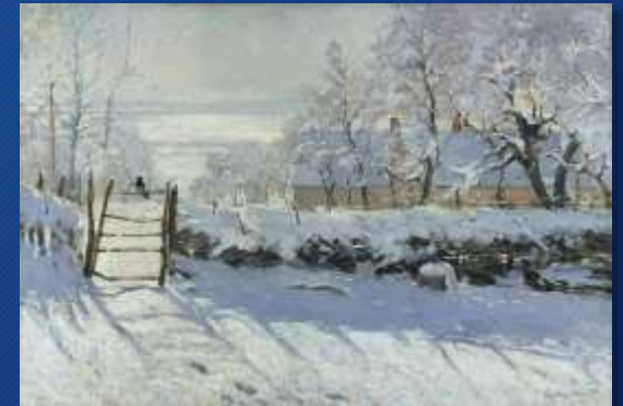
Claude Monet, La gazza, 1868-1869