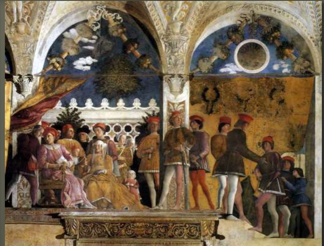
Andrea Mantegna, Palazzo Ducale, Castel San Giorgio, Mantova, 165-1474 d.C.