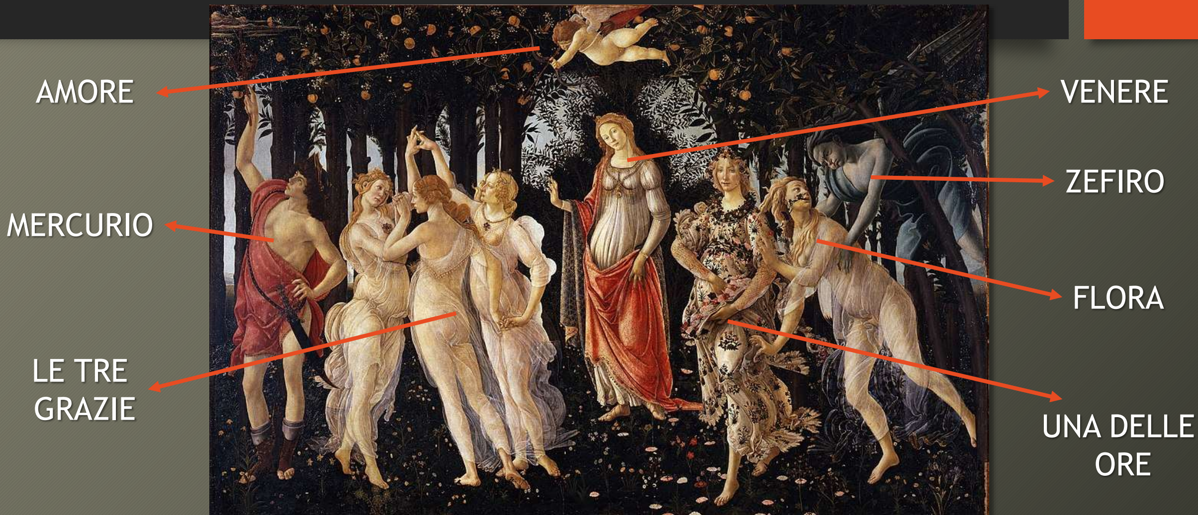
Sandro Botticelli, La Primavera, Firenze, Galleria degli Uffizi, 1477- 1478 d.C.