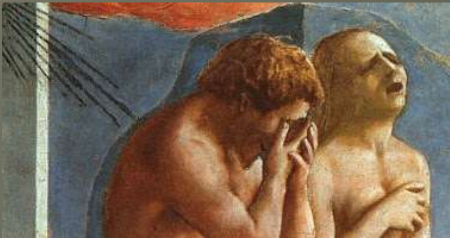
Drammaticità dei volti

Affreschi della Cappella Brancacci nella Chiesa del Carmine a Firenze