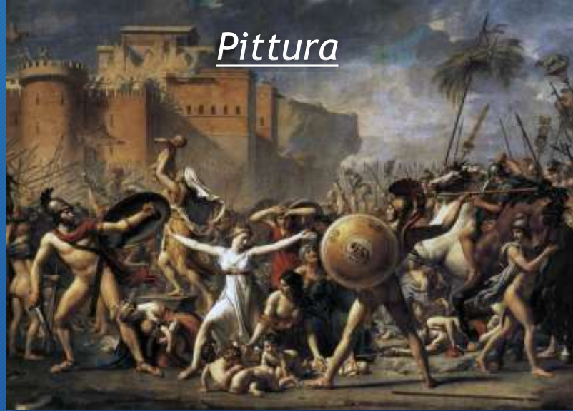
Jacques-Louis David Le Sabine 1794 Museo del Louvre, Parigi