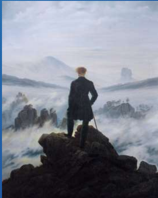
Caspar David Friedrich Viandante sul mare di nebbia 1817 Amburgo, Kunsthalle