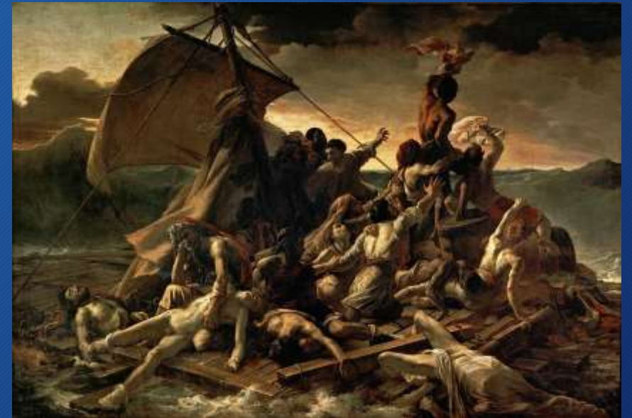
Theodore Géricault La Zattera di Medusa 1818-19, Parigi, Museo del Louvre