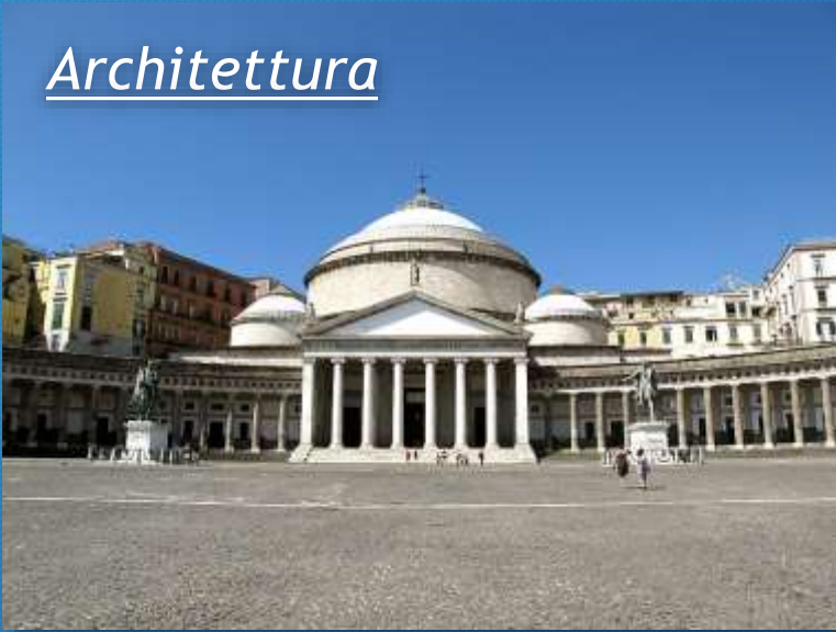
Piazza del Plebiscito, Napoli 1863