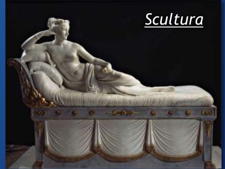
Antonio Canova Paolina Borghese come venere vincitrice, 1805-08 Roma, Galleria Borghese