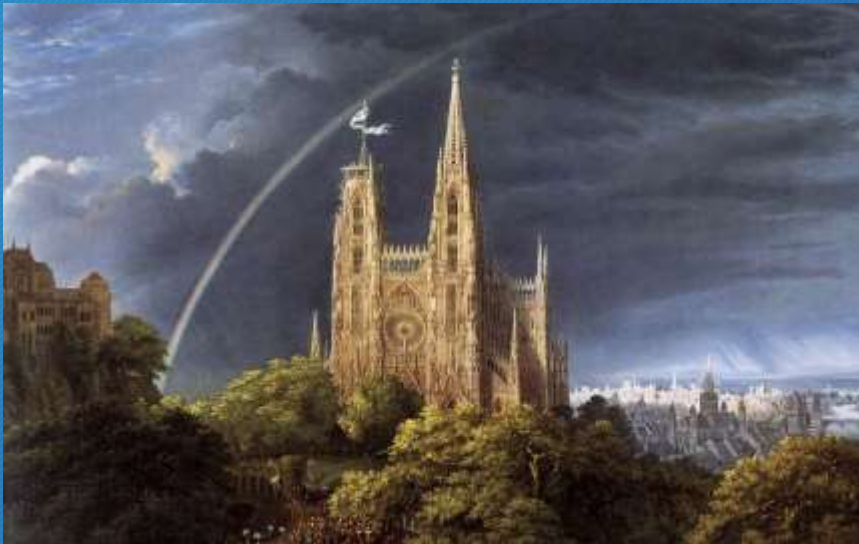
Karl Friedrich Schinkel, Città medievale sul fiume, 1815 Berlino, Staatliche Museen