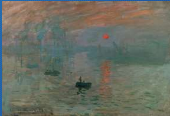
Claude Monet, Impression soleil levant, 1872