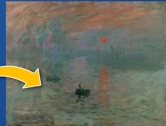
Claude Monet, Impression e soleil levant, 1872

Organizzarono la loro prima mostra collettiva presso lo studio del fotografo Nadar nel 1874