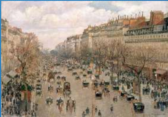
Camille Pissarro, Boulevard Montmartre una mattina d'inverno, 1897