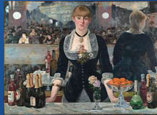
Edouard Manet, Un bar alle Folies-Bergère, 1882