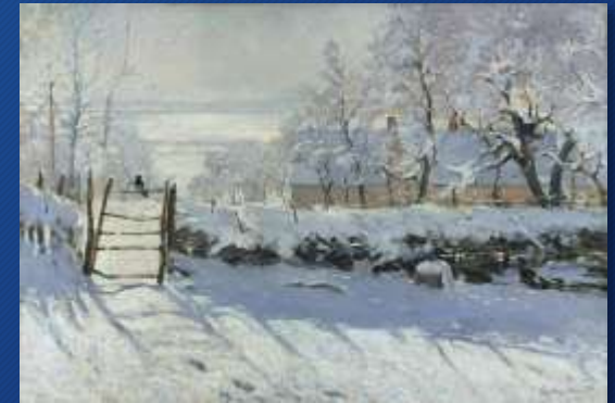
Claude Monet, La gazza, 1868-1869