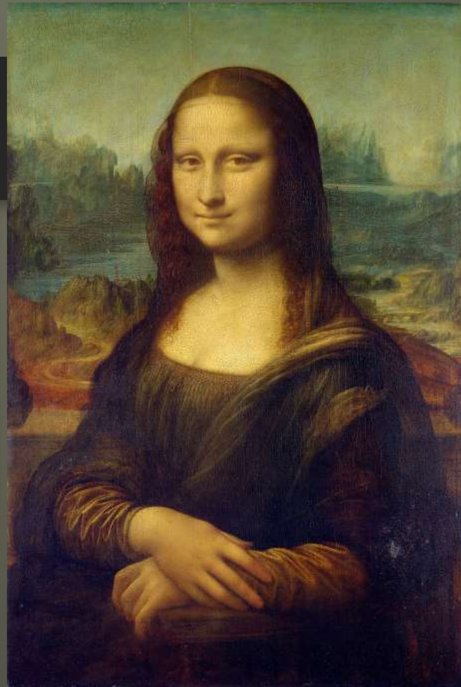
Leonardo da Vinci, La Gioconda, Iniziata 1503-1506 Parigi Museo del Louvre