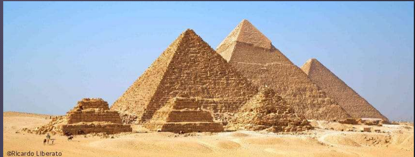
Piramidi di Chefren, Micerino e Cheope (a facce lisce) In primo piano tre piramidi a gradoni Giza, Il Cairo