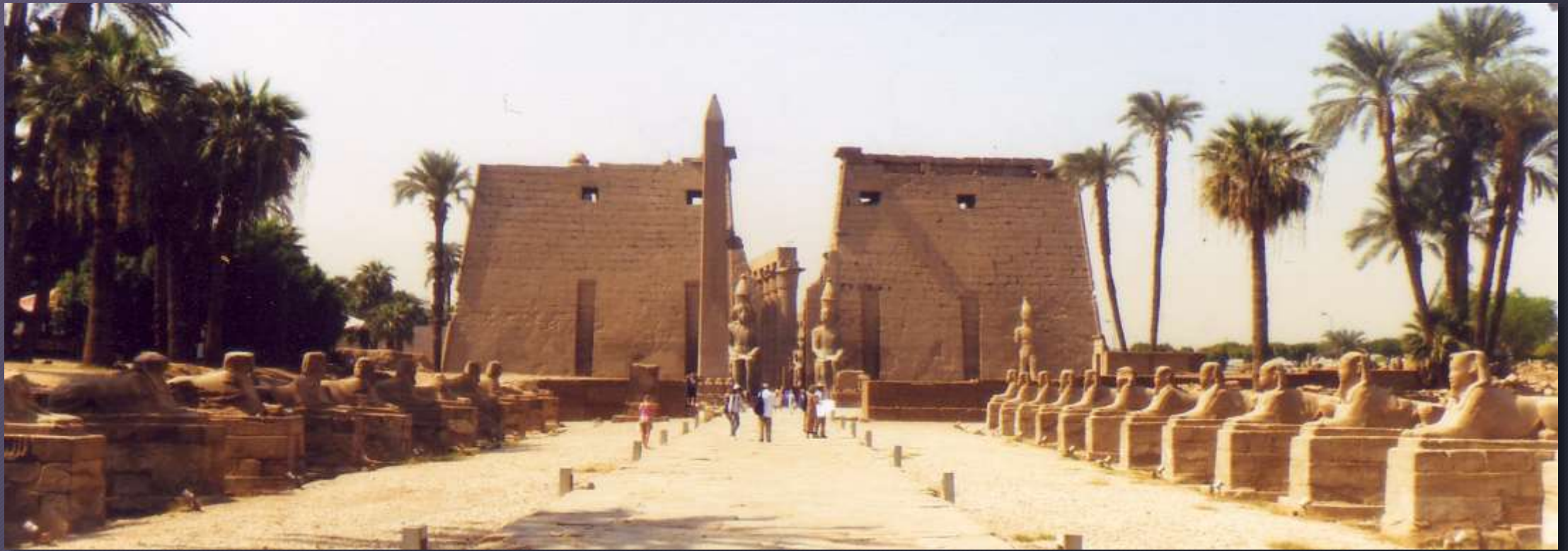
Tempio di Amon