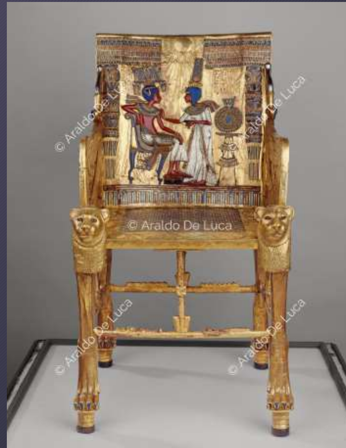
Trono di Tutankhamon Cairo, Museo Egizio