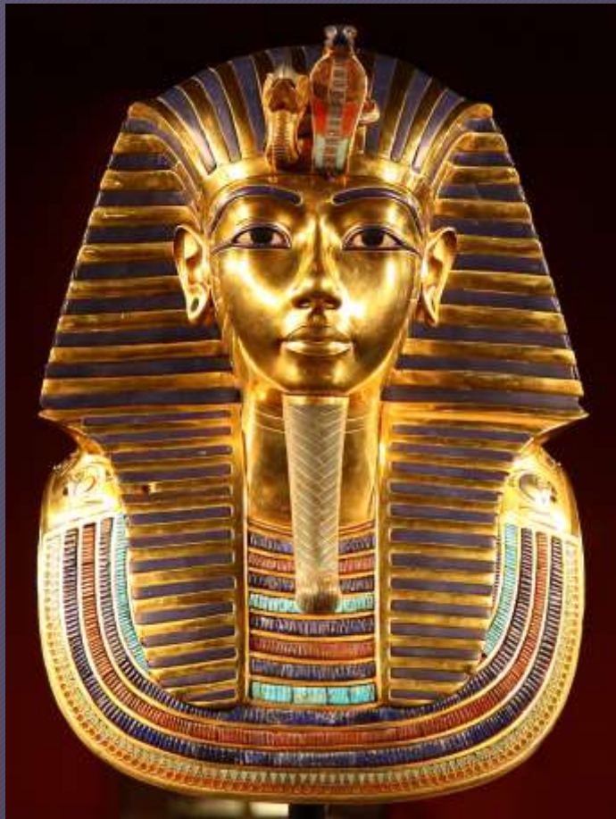
Maschera di Tutankhamon 1325 a.C. Cairo, Museo Egizio