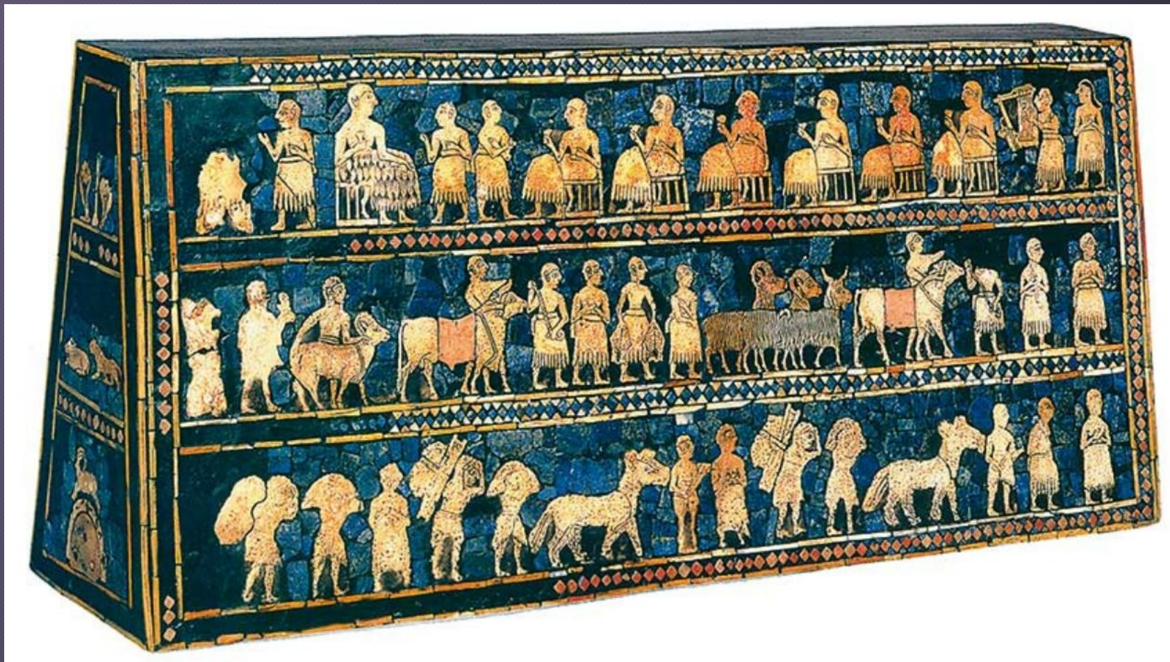
Stendardo di Ur 2500 a.C. Londra British Museum