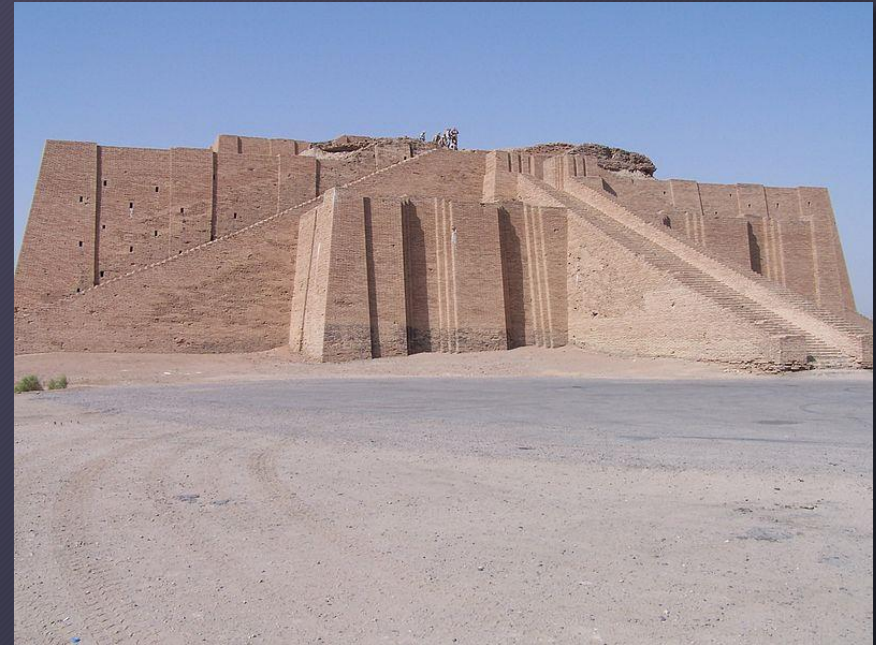
Ziqqurat di Ur, Sud Iraq 2550 a.C.