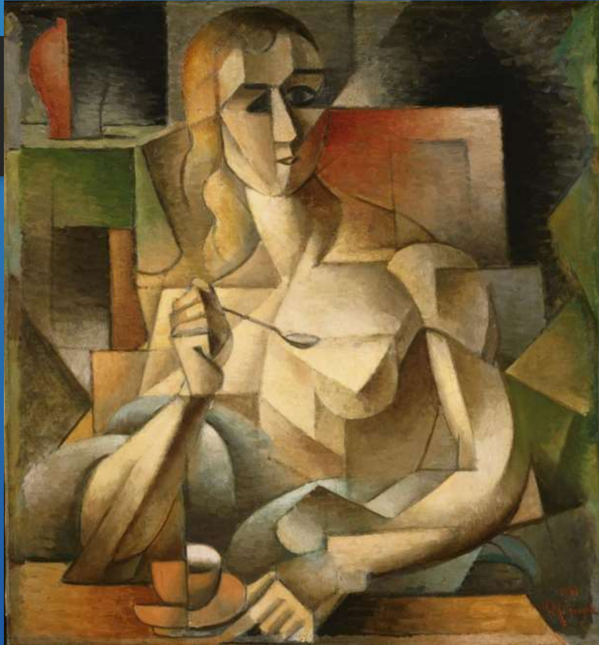
Jean Metzinger L'ora del tè 1911 Philadelphia Museum of Modern Art