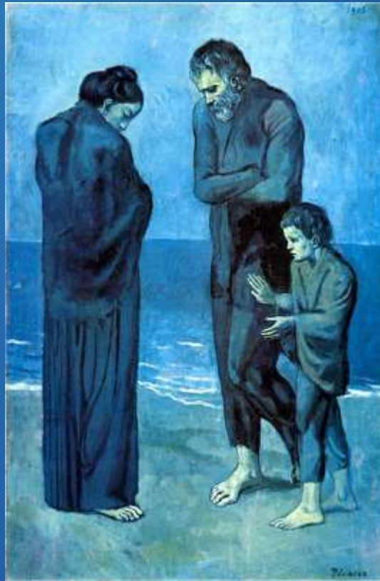
Pablo Picasso La tragedia, 1903, National Gallery of Art, Washington

I soggetti spesso rappresentati sono i miserabili e gli emarginati che hanno sguardi scavati dalla sofferenza e persi nella solitudine.