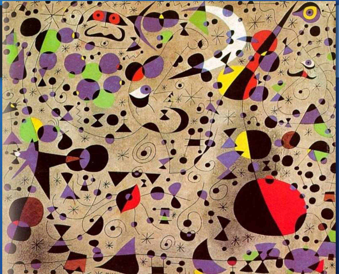
Joan Mirò, La poetessa, 1940 Collezione privata

Le forme ritagliate, ispirate spesso ad animali, uccelli, pesci, insetti e costellazioni, si compongono liberamente su sfondi di colore variegato.