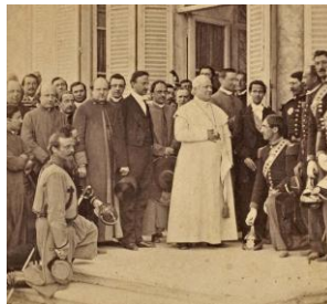
Papa Pio IX

perch  si voleva Roma come capitale d'Italia