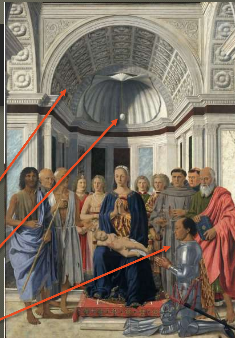
Piero della Francesca, La Sacra Conversazione, 1472-1474, Milano, Pinacoteca di Brera