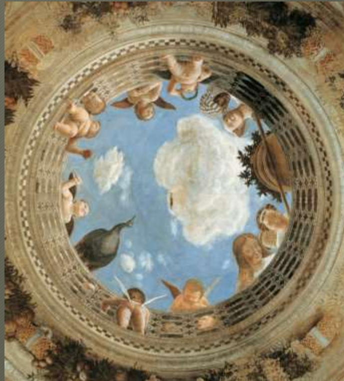
Andrea Mantegna, La Camera degli Sposi, Oculo, 1465-1474, Mantova, Palazzo Ducale, Castel San Giorgio

↓ Sul soffitto si apre una finta finestra circolare in cui si vede il cielo. All'interno e all'esterno della balaustra, le figure sono in scorcio. La prospettiva è dal basso verso l'alto.