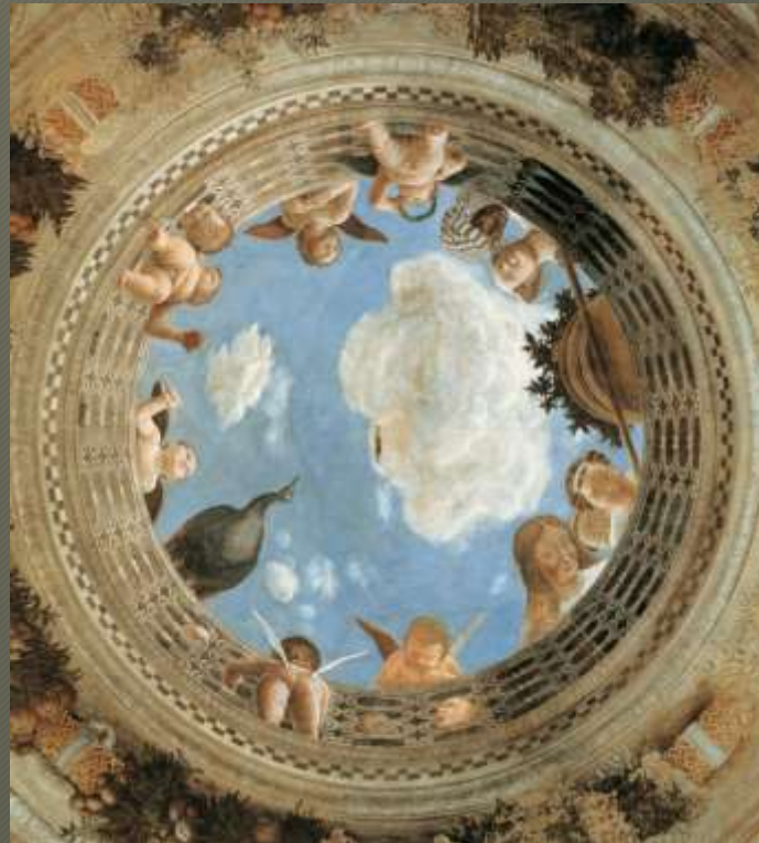
Andrea Mantegna, La Camera degli Sposi, Oculo, 1465-1474, Mantova, Palazzo Ducale, Castel San Giorgio

↓ Sul soffitto si apre una finta finestra circolare in cui si vede il cielo. All'interno e all'esterno della balastra, le figure sono in scorcio. La prospettiva è dal basso verso l'alto.