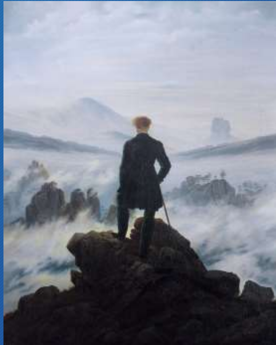
Caspar David Friedrich Viandante sul mare di nebbia 1817 Amburgo, Kunsthalle