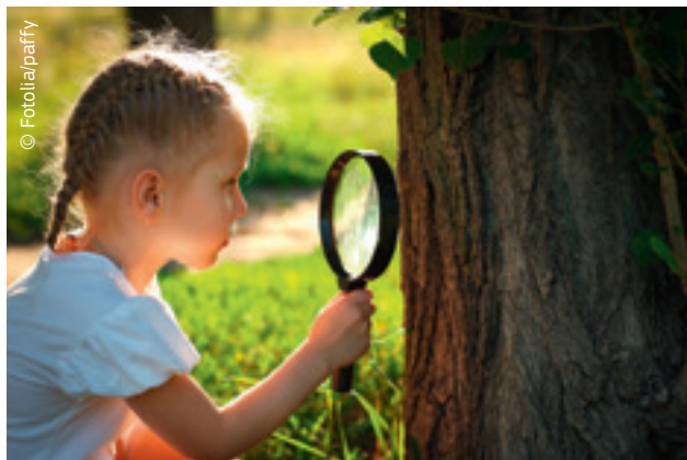
Imparare significa vivere.

Apprendimento permanente significa imparare cose nuove durante tutto l'arco della vita, specie dopo aver completato un ciclo di studi iniziale. Ricorda: non è mai troppo tardi per imparare!