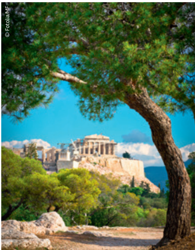
L'istruzione ha determinato il fiorire della civiltà classica greca.

Per il tuo paese: in un mondo che sta diventando sempre più interdipendente, le economie nazionali potranno sfruttare appieno le loro potenzialità soltanto se sono sorrette da un robusto sistema di istruzione e formazione. Un paese che investe in modo intelligente nell'istruzione e nella formazione potrà prosperare negli affari, nella scienza e nelle arti. Inoltre, garantire opportunità educative per tutti contribuisce alla giustizia e coesione sociale.