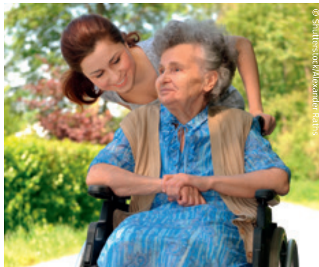
La solidarietà è una scuola di vita.

Apprendimento non tradizionale significa imparare al di fuori dell'ambiente scolastico e formativo usuale attraverso attività organizzate che comportano alcune forme di sostegno, come: