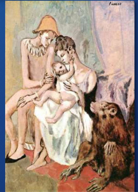
Pablo Picasso Famiglia di acrobati con scimmia, 1905, Göteborg, Konstmuseum

I protagonisti dei quadri sono persone estranee alle convinzioni della società borghese: personaggi del mondo del circo come acrobati, saltimbanchi ecc..