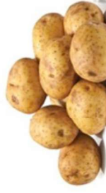
les pommes de terre