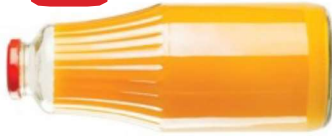
jus de fruits