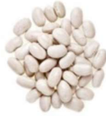
les haricots blancs