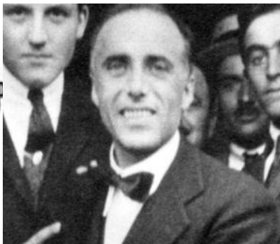
Giacomo Matteotti, ucciso dai fascisti