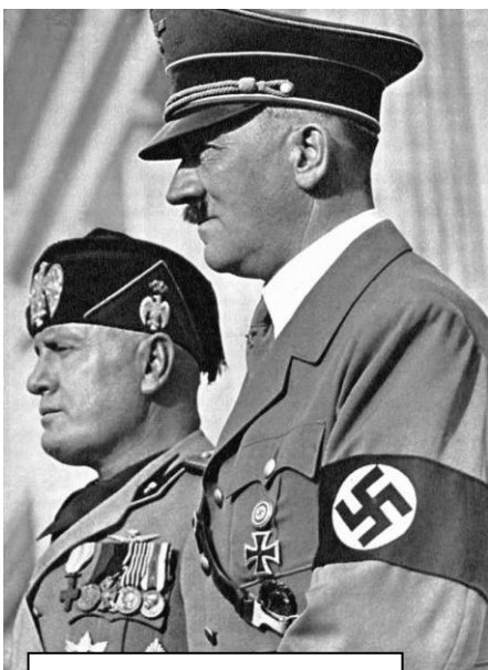
Mussolini e Hitler

Sempre per far diventare grande l'Italia si allea con Hitler , dittatore della Germania, e porterà l'Italia nella Seconda guerra mondiale , causando tantissimi morti, distruzioni e sofferenze