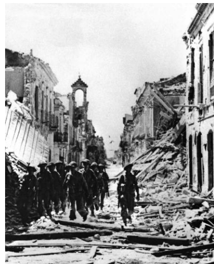
Una città italiana ridotta in macerie durante la guerra